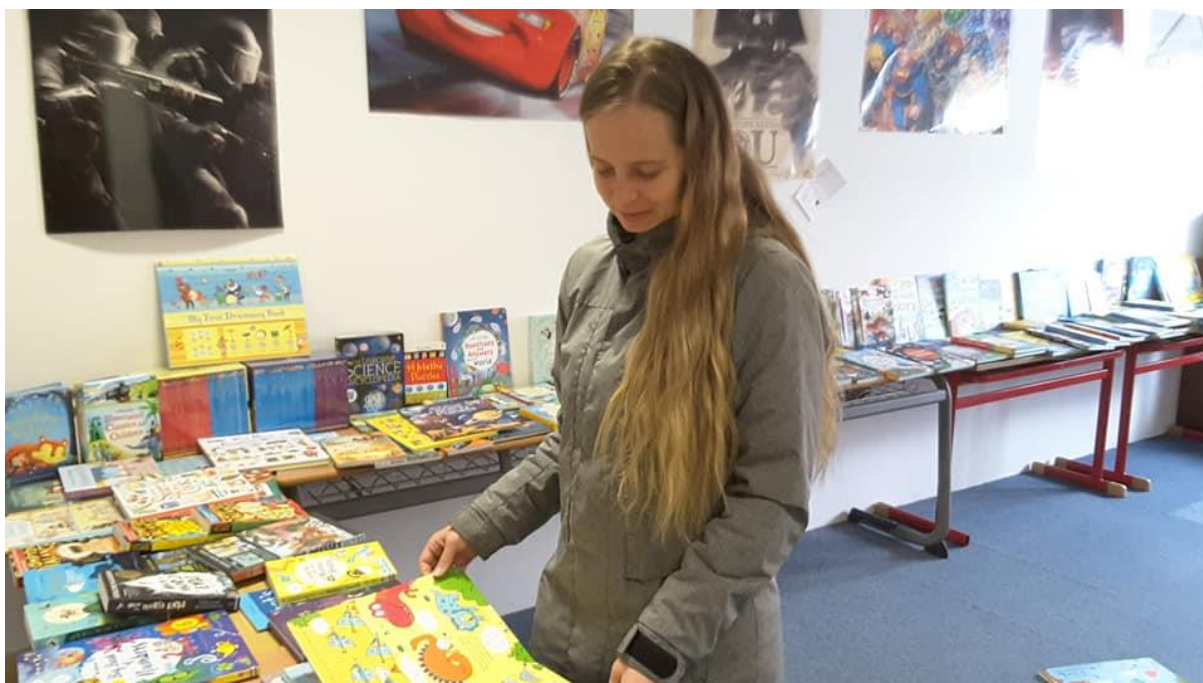
Jarmark anglické literatury