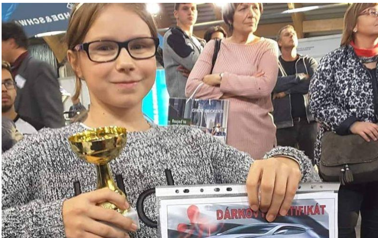
Druhé místo v rétorické soutěži