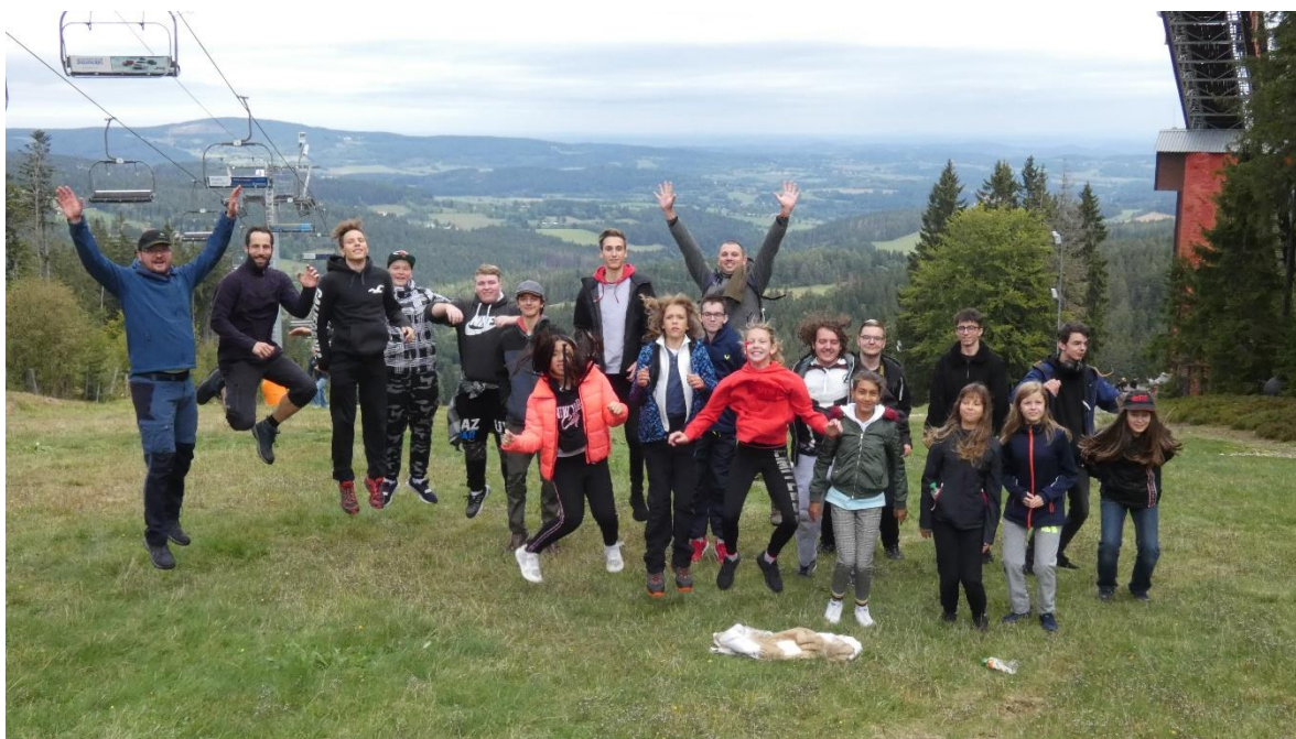
Adaptační kurz Zadov pro 6. ročník a 1. ročník SŠ.