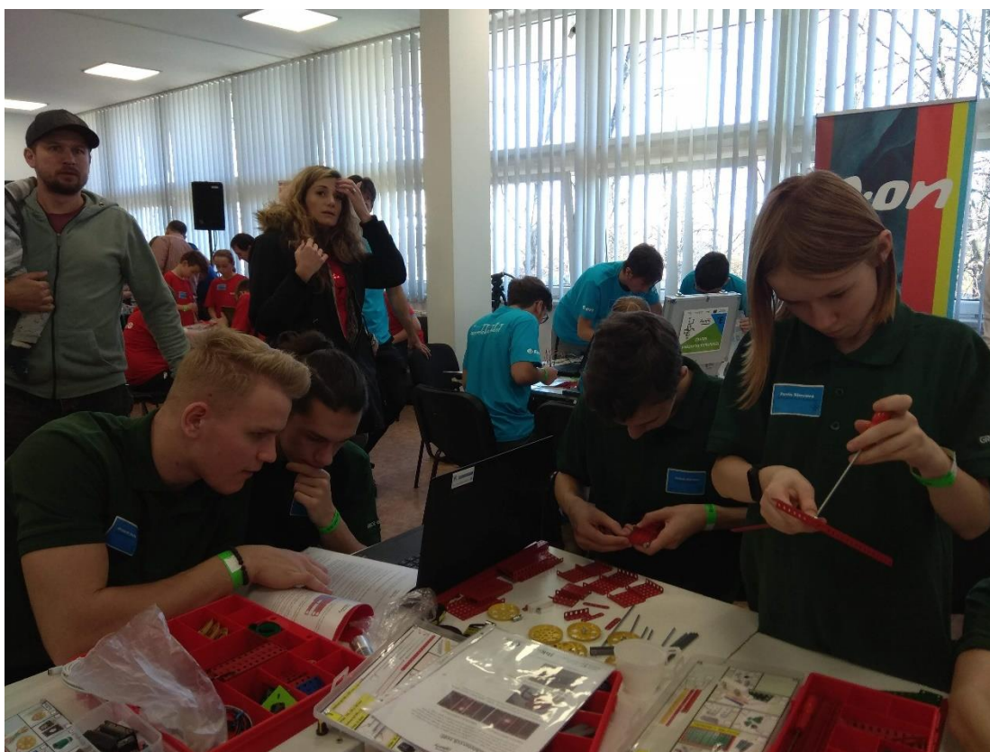
Listopad 2019 T-Profi Talenty pro firmy – celkově žáci naší školy obsadili 3. místo