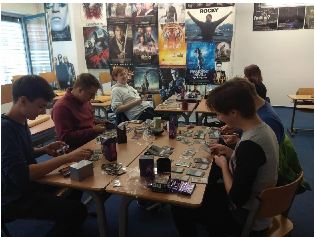
Září 2019 - Turnaj ve hře Magic: the Gathering